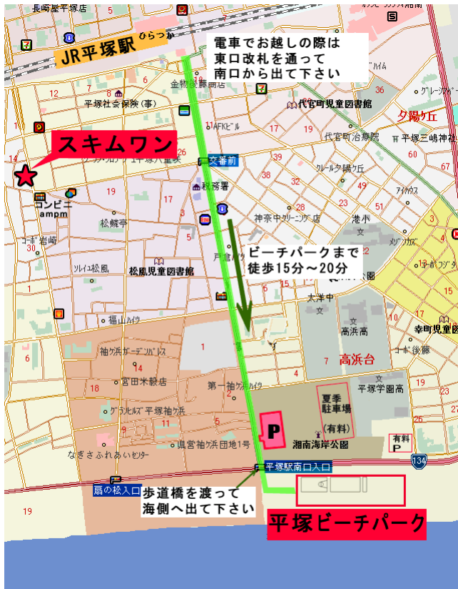
■平塚駅～平塚ビーチパークの地図

お申し込み: 4 日前までにインターネット( http://www.skim1.com/school/ )にてご予約下さい。